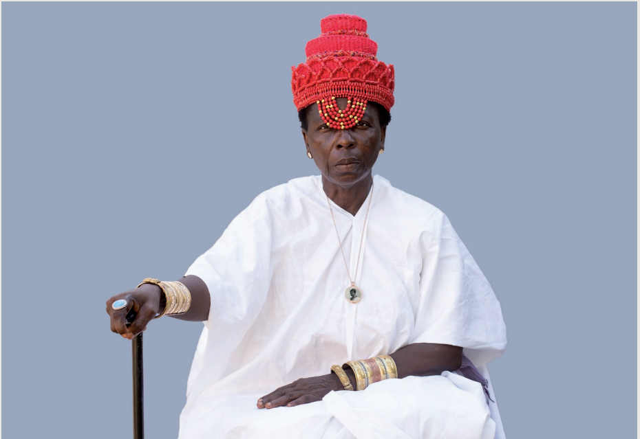
Série AGBARA Women /Projet AGBARA Women, 2020

Expositions - Ateliers - Théâtre - Concerts - Jeune Public